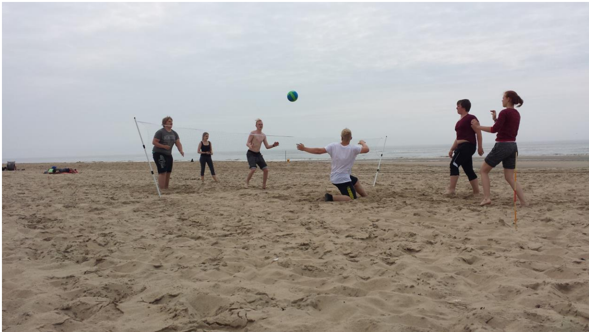
Mutige junge Menschen im Selbstexperiment mit sich und ihrem Verhalten beim suchtpreventiven Beachvolleyballspiel

All dies geschah im Einverständnis der jungen Menschen freiwillig und mit der Maßgabe sich und die eigenen Handlungsweisen und (Gruppen-)Rituale bei diesem Experiment bewusst selbst zu beobachten, zu ergründen und in der Gruppe zu reflektieren mit der Zielsetzung den bisherigen Umgang mit Suchtmitteln und süchtigen Verhaltensweisen kritisch zu hinterfragen und alternative Erlebnisformen auszuprobieren und anzulegen. All dies erfordert Vertrauen und Mut.