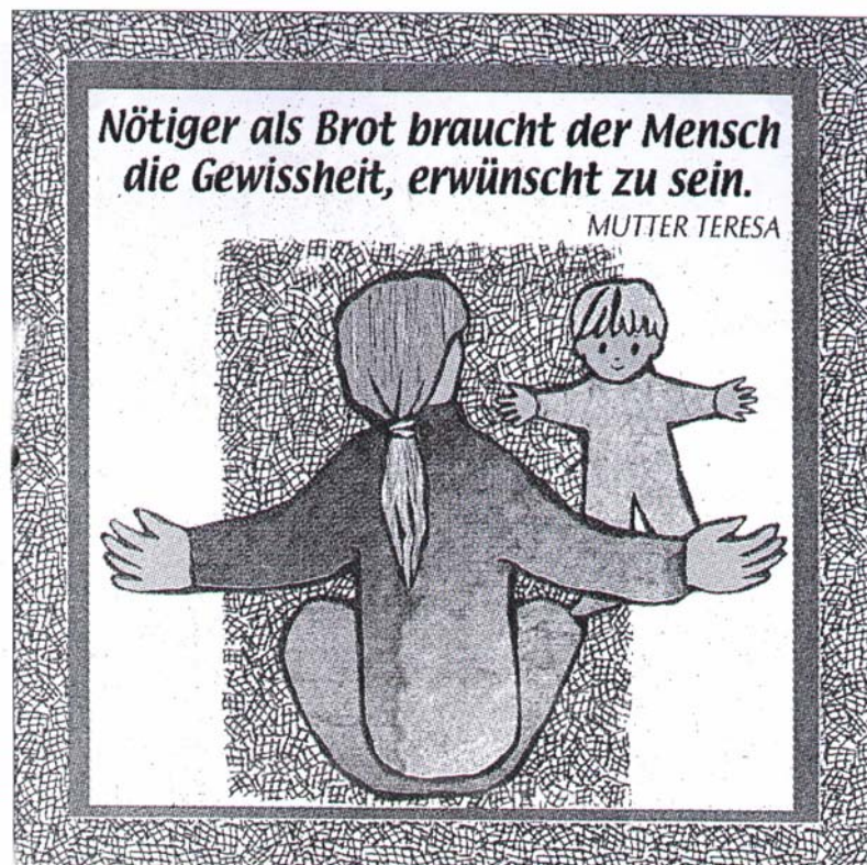
Grafik: Beate Heinen

Auch Werbung, Medienwelt und gefährliche Gruppierungen haben hier leichtes Spiel, die Jugendlichen auf Ihre Seite zu ziehen. Botschaften wie „Du bist uns wichtig!“, „Bei uns bist du anerkannt, gehörst du dazu, wenn...“, „Du bist toll, du bist cool, wenn du...“ fallen auf fruchtbaren Boden, wenn das Selbstwertgefühl der jungen Menschen keine andere Nahrung findet und Alternativen fehlen.